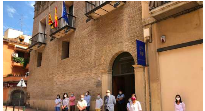
Desde el 1 de junio la sede del Justicia reanuda la atención presencial

de postergar críticas catastrofistas y contribuir todos juntos a salvar vidas y minimizar los impactos negativos de semejante tsunami.