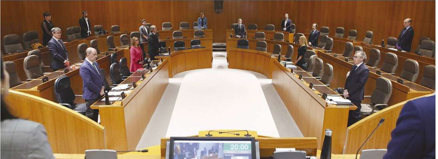
El Pleno de las Cortes de Aragón, con pocos diputados presentes, guarda un minuto de silencio por las víctimas de la Covid-19

En junio de 2018, recién aterrizado en el Justiciazo fui entrevistado por vuestra Revista “Graduados XXI” y ante la pregunta de mi relación con los graduados sociales la valoraba positivamente ya desde mi etapa como juez decano (2008-2017) porque aprecié su gran trabajo para lo que es propiamente suyo: el derecho laboral y seguridad social, indemnizaciones, incapacidades, invalideces, etc. Siendo expertos y especialistas. Os han equiparado a través de la legislación y la jurisprudencia en la defensa de los trabajadores en la jurisdicción social y en los recursos.