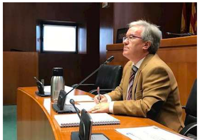
El Justicia de Aragón compareciendo en las Cortes de Aragón el pasado mes de abril

En 2019 creo que hemos demostrado que nuestra función esencial ha sido generar diálogo, tender puentes entre administraciones y ciudadanía, posibilitando encontrar acuerdos porque de esa forma lo-