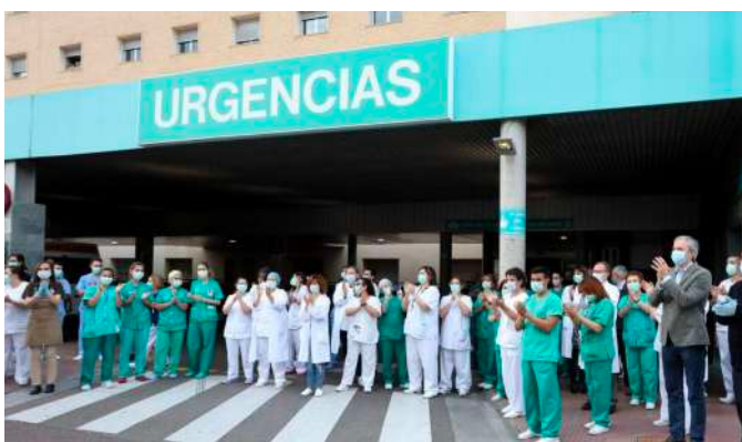
Aplauso sanitario a las puertas del Hospital Miguel Servet

Nuestro deseo en 2020 era seguir en la línea emprendida y agradecer a los aragoneses la confianza que depositan en el JUSTICIA DE ARAGÓN cuando en marzo de 2020 nos asola la mayor pandemia general, con más de 30.000 muertos en España (80 % mayores de 70 años) y más de 300.000 en el mundo. Nos estamos enfrentando a una crisis sanitaria, económica y social sin precedentes en la que hemos evidenciado la situación de fragilidad y dependencia del ser humano frente a un virus invisible. Hemos