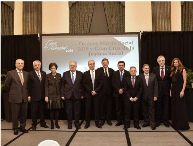
Foto de familia con todos los premiados en la ceremonia del CGCOGSE